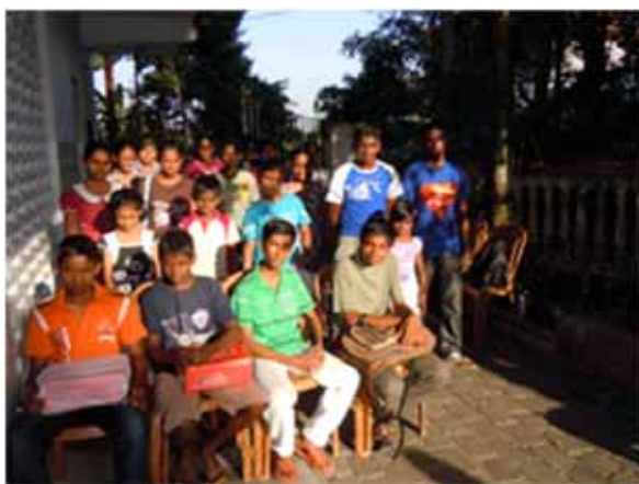
Fadderbarn på Suhada Home