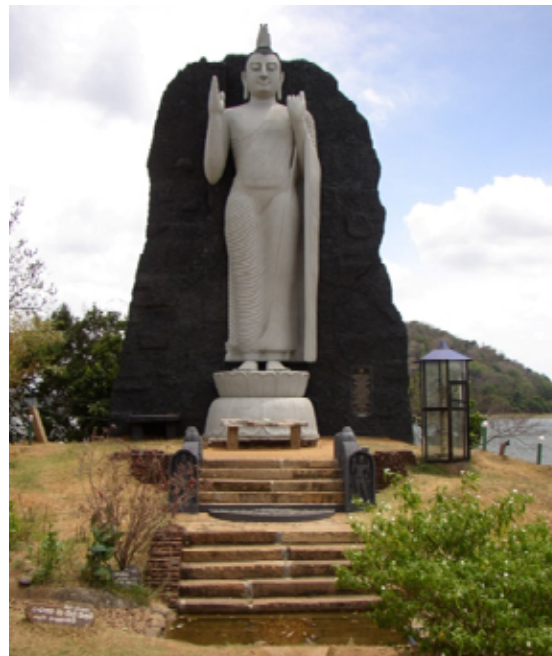
Buddhastaty utefter väg A11

Efter 26 år av väpnad konflikt, främst koncentrerad till norr och öster, besegrade regeringsstyrkorna i maj 2009 den tamilska separatistorganisationen LTTE (Liberation Tigers of Tamil Eelam).