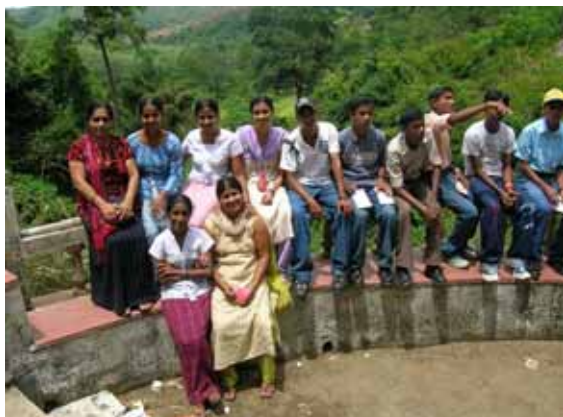
Fadderbarn MSP 1-3 på MCC

barnen. Fadderbarnen har tillgång till aktiviteter vid MCC.