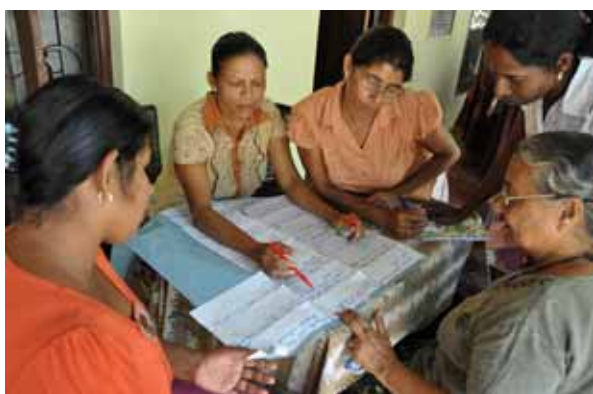
Wilpothas kvinnor i projektarbete

"Kapacitetsutveckling och Attitydförändring" ett utvecklingsprojekt med medel från Forum Syd.