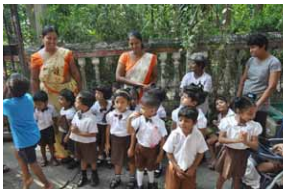
Förskolebarn på Suhada Home

Ett av våra äldsta projekt är Suhada Home. När vi 1980 inledde samarbetet med Sunethra - Sri Lankas "Moder Theresa" - anade ingen att vårt samarbete skulle utvecklas till att bli ett av SLBV:s längsta projekt. På Suhada Home bor ett sextiotal barn, ungdomar och äldre. De flesta har fysiska och/eller psykiska funktionshinder.