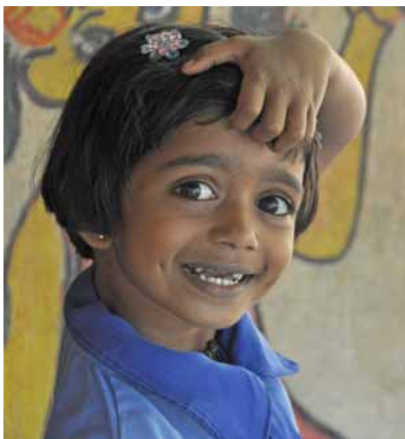
Förskolelev från Wilpotha

V i tror på att alla barn och unga har samma rättigheter och lika värde.