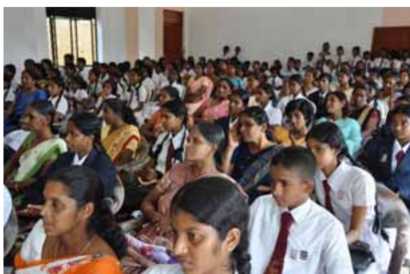
Även elevernas föräldrar deltar i utbildningarna