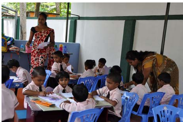
Ny undervisningslokal ute i trädgården

Inom MCC drivs bland annat en förskola som under 2011 utökats till att kunna ta emot 45 barn i åldrarna 3-5 år. Till förskolan har även en ny undervisningslokal byggts ute i trädgården.