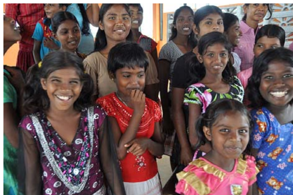
Flickor i varierande åldrar boende på Arudpany`s Girls Home i Batticaloa

På Arudpany`s Girls Home bor drygt 20 flickor från 3-4 år upp till 20 år. Flickorna kommer alla från svåra hemförhållanden. Många av flickorna har bara en eller ingen förälder i livet.