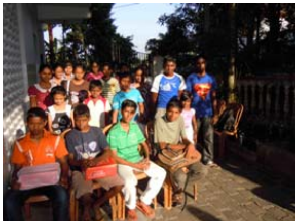
Sponsorbarn på Suhada Home (fadderbarn)