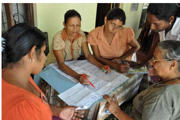
Wilpothas kvinnor i intensivt projektarbete

SLBV har tillsammans med WKIP beviljats medel till ett 2 årigt projekt.