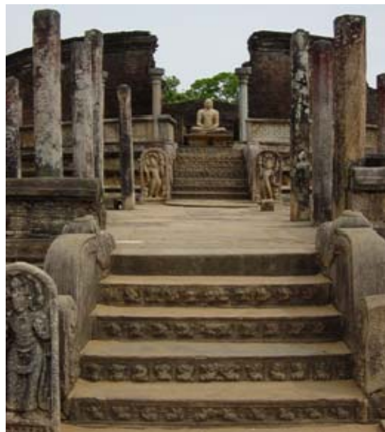
Tempelruin i Polonnaruva

Efter 26 år av väpnad konflikt, främst koncentrerad till norr och öster, besegrade regeringsstyrkorna i maj 2009 den tamilska separatistorganisationen LTTE (Liberation Tigers of Tamil Eelam). Slutstriderna blev mycket blodiga och medförde en svår humanitär kris. Efter kriget placerades närmare 300 000 internflyktingar i stängda läger. Många av dem har nu kunnat återvända men behoven av återuppbyggnad av bostäder och infrastruktur i Sri Lanka är mycket stora. Landet står också inför utmaningen att uppnå nationell försoning och en långsiktigt hållbar fred. Samtidigt uppvisar landet de största inkomstskillnaderna i hela Sydasiens och inflationen är mycket hög. Kriget har varit oerhört kostsamt och Sri Lanka har även drabbats av den globala finanskrisen.