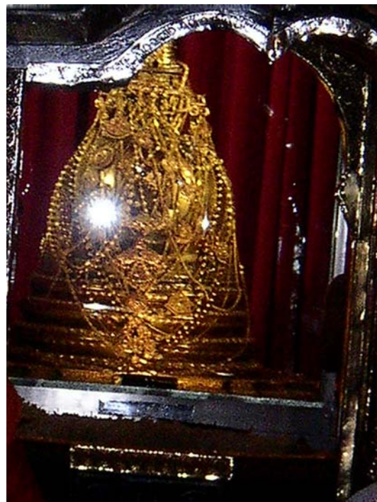
I "Tandtemplet" i Kandy förvaras en tand från Buddha i detta skrin av guld, behängt med gåvor av guld och ädla stenar

förmögenhet till att upplåta sitt hem åt föräldralösa flickor.