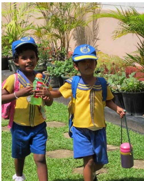
Förskolebarn på Matara Child Center

samband med sponsorbrev och julbrev. Några av föreningens medlemmar har under det gångna året gjort mycket stora privata donationer riktade till SLBVs projekt bland annat Matara Childrens Center (MCC) och barnhemmet Arudpany i Batticaloa.